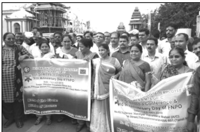
Women employees and delegates, visitors present in the rally during 21 st AIC